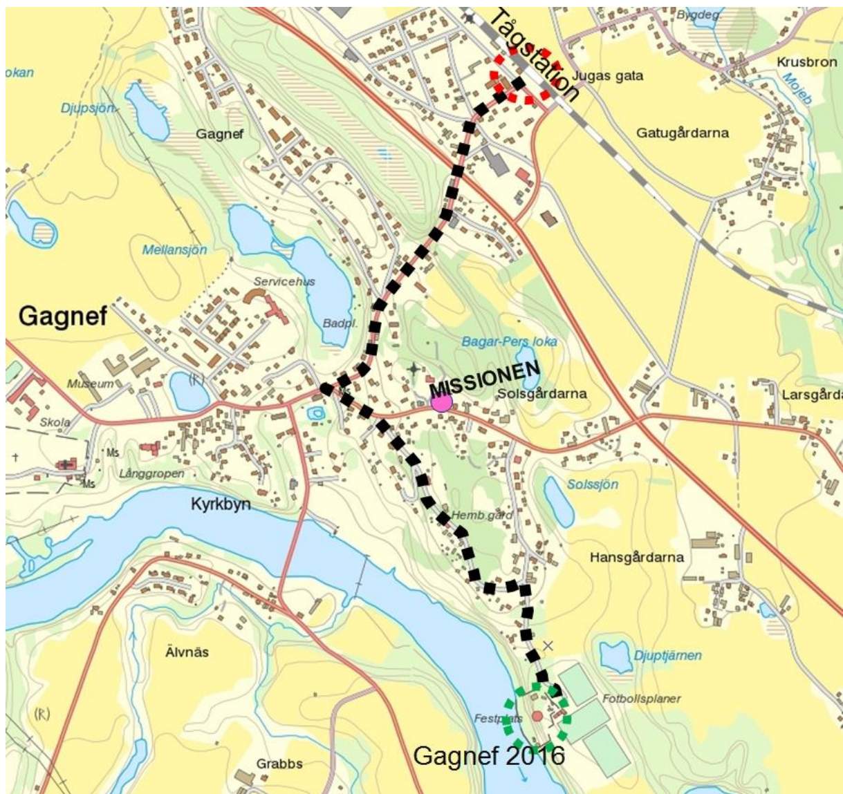
Karta med promenadstråk från tågstation till festivalområde

Ta gärna tåg till Gagnef, det är endast 2 km från tågstationen till festivalen och stor sannolikhet att få sällskap och skjuts, annars en underbart fin promenad med utsikt över älven.